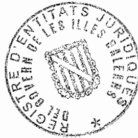
Catalina Bibiloni Salord