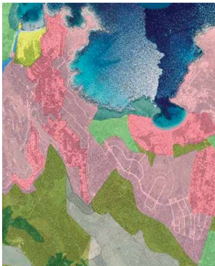
Sòl urbanitzable a Son Bou i Torre-solí.