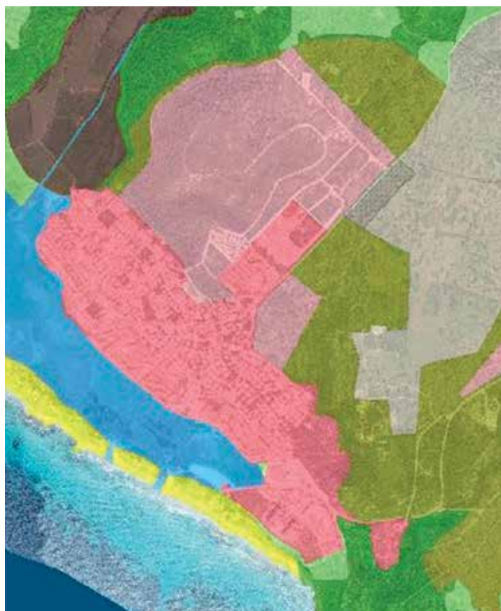
Sòl urbanitzable al nord des Mercadal.

Al mateix temps, cal afrontar la necessitat d'agilitzar els tràmits i combatre l'excessiva lentitud administrativa que de vegades es mostra en casos que no són conflictius. Però això no s'aconsegueix modificant lleis per a desprotegir el territori, sinó racionalitzant el funcionament de l'administració pública. ■