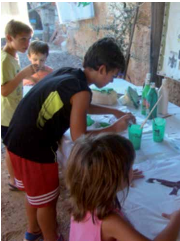
Activitat amb fillets al Centre de Recuperació de Fauna Silvestre.

Segueix en marxa la campanya Apadrina 1m 2 del Centre de Recuperació de Fauna Silvestre, que dóna l'oportunitat a tothom que vulgui d'ajudar-nos a seguir realitzant aquesta feina necessària per a la gent i la fauna de Menorca. ■