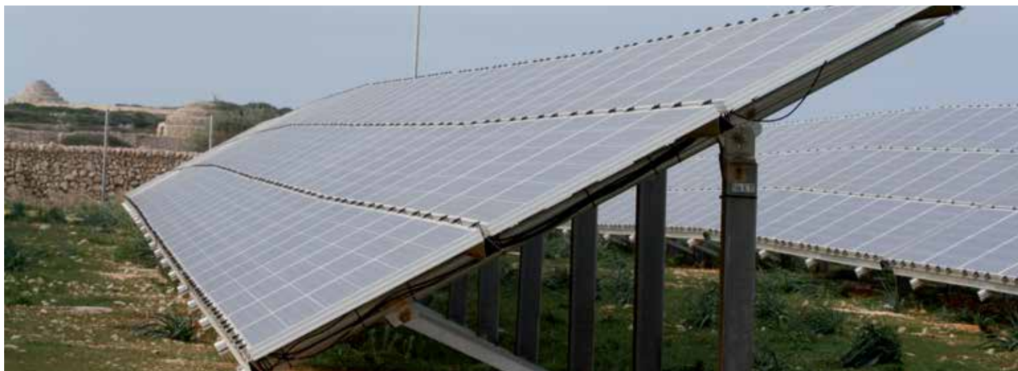
Parc solar de Son Salomó

Poder avançar en la producció d'energia provinent de fonts renovables és un dels reptes que ha d'abordar Menorca sense més dilació, però ho ha de fer buscant la manera de no perdre el valor territorial i paisatgístic de l'illa. Des del GOB creiem que això es pot fer acordant uns criteris que busquin la compatibilitat.